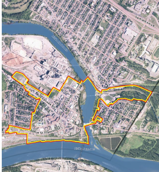
Centre-ville (incluant le Parc Petit-Sault)